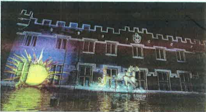
Jusqu'au 10 septembre, une projection gratuite se déroule sur la façade du musée du Petit Palais, de 22 heures à minuit.

La mise en son et lumière de la ville s'étend, cette année, au musée du Petit Palais. De 22 heures à minuit, jusqu'au 10 septembre, en boucle, se déroule une projection de dix minutes sur le thème du soleil. D'où Hélios, divinité de la mythologie grecque, et nom de cet événement. « Le soleil est omniprésent en Provence », explique l'élu André Mathieu.