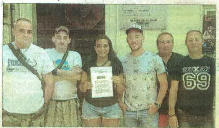
Une partie de l'équipe du Redzone.

Contactée par nos soins, l'équipe du Redzone réplique en expliquant « ne pas avoir été entendue par le tribunal, car pas défendu par notre propre avocat ». Elle a donc décidé de faire appel et de changer d'avocat. Le Redzone avait notamment demandé une contre-expertise sur les dépassements de décibels ; mais la copropriété aurait refusé de recevoir ce nouvel expert.